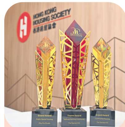
▲ 香港房屋協會轄下項目雋悅和祖堯邨在今屆「優質物業設施管理大獎」中脫穎而出，前者勇奪「住宅類別——社區住宅」大獎和「年度主題大獎——幸福和諧社區類別」，後者亦獲頒「住宅類別——公共租住屋邨」大獎。

香港房屋協會（下稱房協）多年來秉持以人為本的服務理念，致力為市民提供可負擔的優質房屋及相關服務。憑藉在物業管理方面的卓越表現，房協的出租屋邨「祖堯邨」和非資助長者房屋項目「雋悅」分別在「公共租住屋邨」和「社區住宅」類別，獲得最高殊榮的大獎。而「雋悅」更在「建立幸福和諧社區」評審準則獲最高評分，成為首屆「年度主題大獎」得主，肯定房協優質管理的表現，亦印證不論是公共房屋還是非資助項目，房協均關顧居民的福祉和需要，以貼心服務為居民增添幸福感和歸屬感。