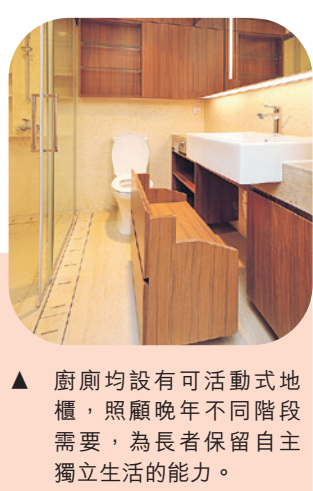
▲ 廚廁均設有可活動式地櫃，照顧晚年不同階段需要，為長者保留自主獨立生活的能力。