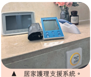
▲ 居家護理支援系統。