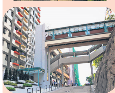
▲ 祖堯邨依山而建，為方便住戶出入，房協十年前特別斥資逾千萬港元興建轉乘升降機及行人天橋。