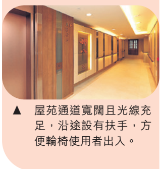
▲ 屋苑通道寬闊且光線充足，沿途設有扶手，方便輪椅使用者出入。