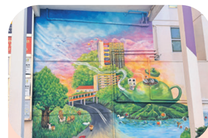
▲ 祖堯邨近年推行「心靈友善屋邨」計劃，與不同界別持份者合作，將藝術及靜觀融入社區，提升居民心靈健康與幸福感。